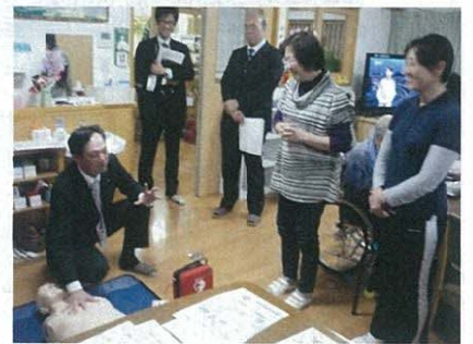
AEDを設置し、使用方法の研修を受けました。