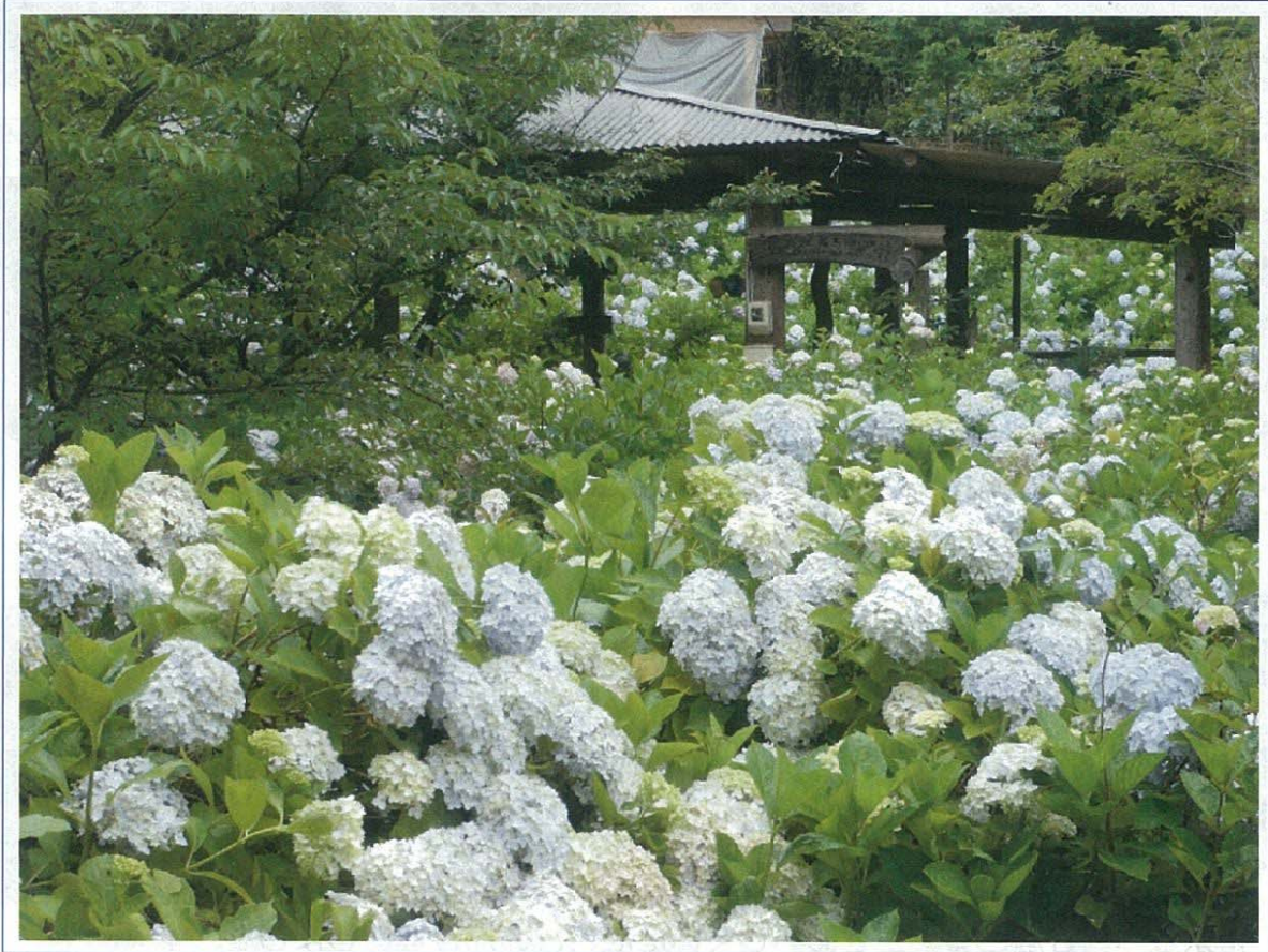
( 矢掛町上高末のあじさい畑 )