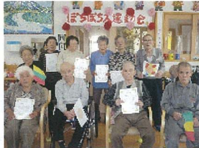
運動会の様子。パン食い競争にあめ玉食い競争、綱引きなど盛りだくさん。