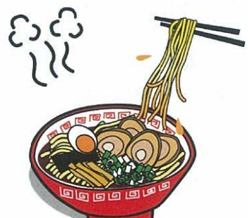
ラーメンパラダイス笠岡へ。行列がいっぱいでラーメンは食べられず。代わりに噂のラーメンドックをゲット。