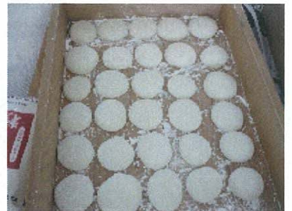
● ほたるの会の皆さんと一緒に正月に向けて餅つきをしました。