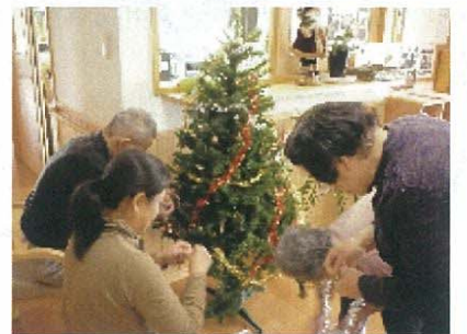
● 日常の風景。クッキーを作ったり、黒豆の収穫や五目並べなどおもしろいことをしています。