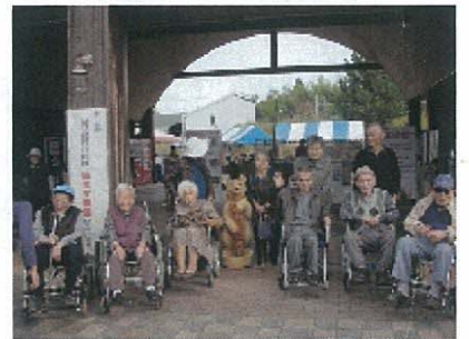
バスに乗って福山市立動物園へ行ってきました。