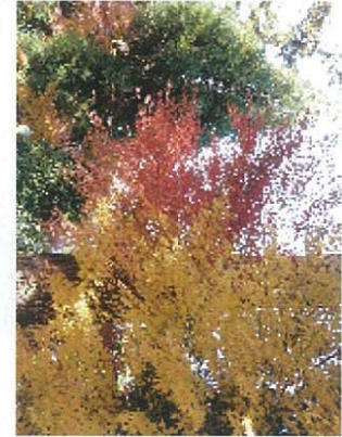
● 鴫方の明王院へ紅葉を見に行きました。赤と黄色のコントラストが鮮やかです。