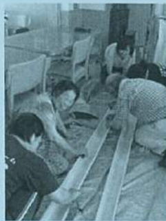
スタッフのつぶやき

ぼちぼちでは、そうめん以外にミニトマト・錦糸卵・カニカマ・きゅうり・ナスを流しました!!ミニトマトが流れ出すと「トマトが来たでー」と賑やかになりました。取れなかった利用者さんに、流れを止めて下さる利用者さんが声をかけたりと和気あいあいでした(*'▽'*)