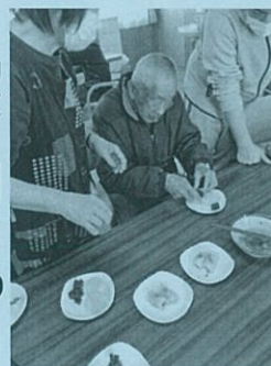
「ごりゃわし 途中で少し お花見へ」と

「ごりゃわし 途中で少し お花見へ」と の嫁か？」と冗談を言われる場面も(笑)4月は、送迎足を延ばし車越しの花見を。みんなでお弁当を持っていうわけにはいきませんでしたので、「ぼちぼち」で関東風の桜餅を作り、皆で春を感じました。一日も早く皆さんと“外”を楽しめる日々が返ってくることを願いつつ、室内での楽しみをたくさん考え、ガマンの子となります!!(林田恵美)